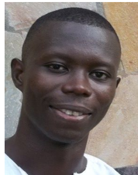
Directeur de E-Educ

Démarré Sep 2015 à Lomé ! Inauguration à l'Hôtel PALM BEACH avec un BIG BANG!