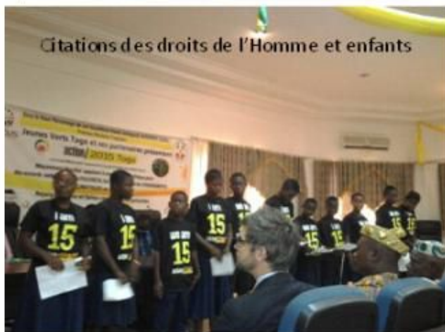
Citations des droits de l'Homme et enfants