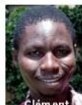
Clément Chef Resto