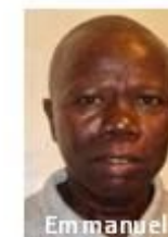
Emmanuel 1. Conseil