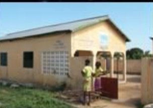
RÉNAAT est né Le 10 Juillet 2015 avec 23 fondateurs dans l'Agro Ecologie