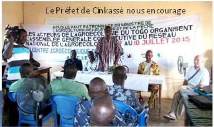
Le Préfet de Cinkassé nous encourage

SOUS LE HAUT PATRONAGE DU MINISTRE DE L'AGRICULTURE DE L'ÉLEVAGE ET DE LA PÊCHE LES ACTEURS DE L'AGROÉCOLOGIE DU TOGO ORGANISENT L'ASSEMBLÉE GÉNÉRALE CONSTITUTIVE DU RÉSEAU NATIONAL DE L'AGROÉCOLOGIE AU 10 JUILLET 2015 LE CENTRE AGROÉCOLOGIQUE DE L'AREJ