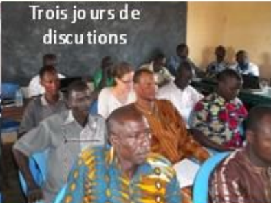
Trois jours de discussions