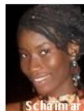
Schaïmar Sec Adj