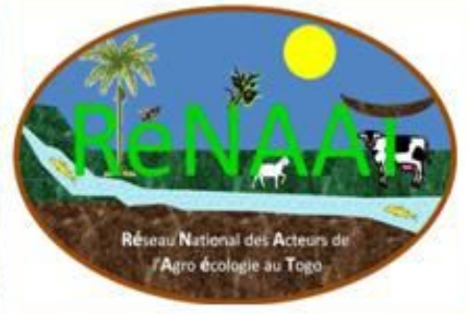
Réseau National des Acteurs de l'Agroécologie au Togo