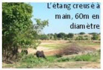
L'étang creusé à main, 60m en diamètre