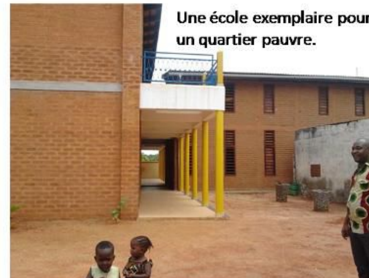
Une école exemplaire pour un quartier pauvre.

CSFi Afrique Togo aide avec l'hébergement du coordinateur et la rénovation électrique dans le Complexe Mon Devoir qui contient l'école primaire, secondaire et un lycée. Environ 800 élèves d'un quartier des plus pauvres de Lomé.