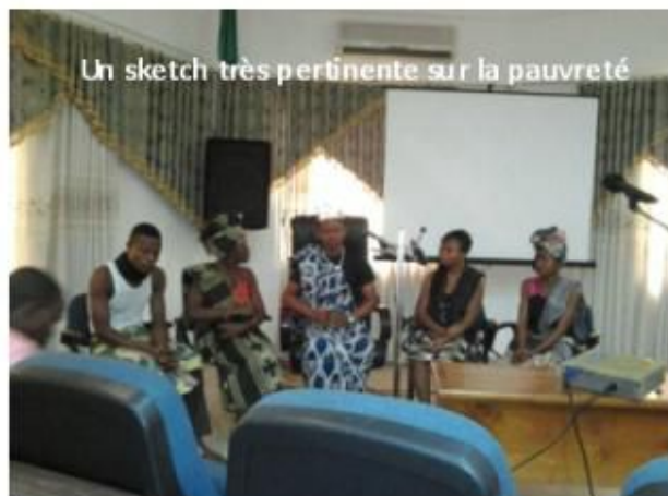
Un sketch très pertinente sur la pauvreté