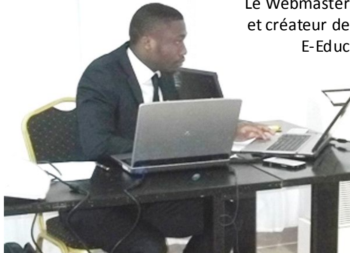
Le Webmaster et créateur de E-Educ