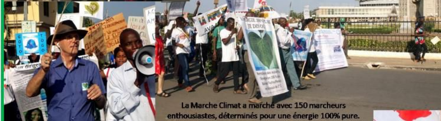
La Marche Climat a marché avec 150 marcheurs enthousiastes, déterminés pour une énergie 100% pure.