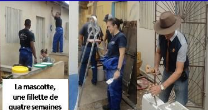
La mascotte, une fillette de quatre semaines

13 Flages 199x32M Équipe 160 Passager 450 Hélicoptères 32 Véhicules 70 Barges 3