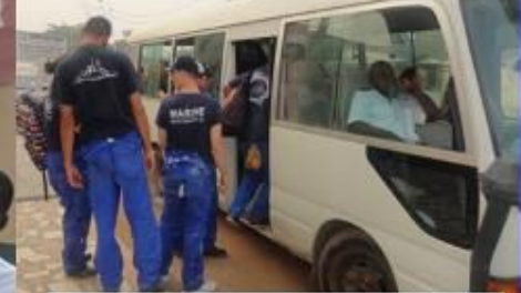
Le FAT a assuré le transport.