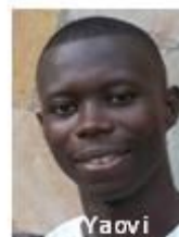
Yaovi Dir E-Educ