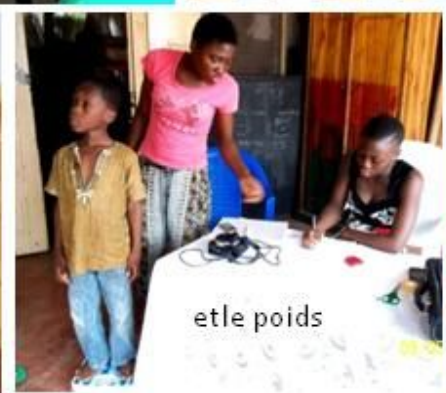
et le poids