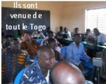
Ils sont venus de tout le Togo