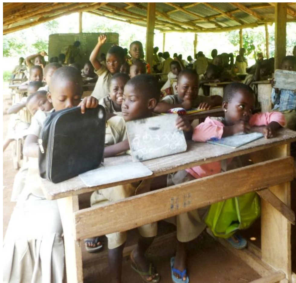
EPP Hiheatro Centrale 72 élèves dans l'appâtâmes