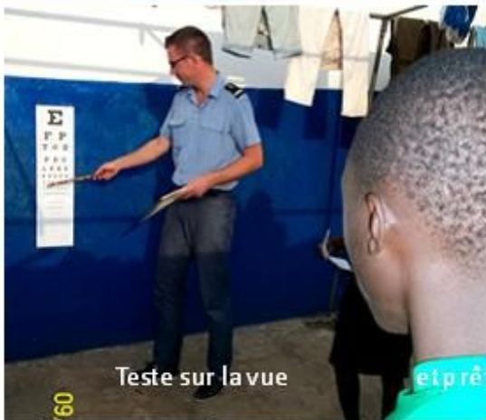
Teste sur la vue